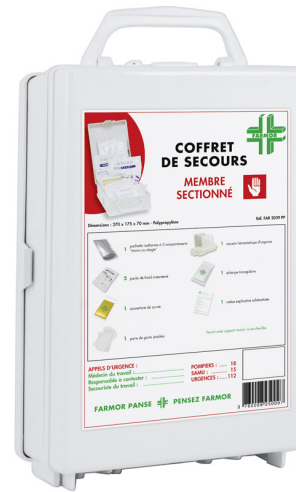
Ref : FAR 2039 PP

Grâce à sa gamme «Soins des yeux» FARMOR vous offre la possibilité de choisir le produit adapté à vos besoins.