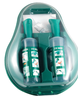
Ref : DUO 7502 OC

Grâce à sa gamme «Soins des yeux» FARMOR vous offre la possibilité de choisir le produit adapté à vos besoins.