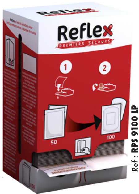
Ref : RPS 9100 LP

Grâce au REFLEX, les soins des petites et moyennes coupures ont enfin trouvé leurs solutions. Son système de fixation murale amovible, au moyen de ses pastilles auto agrippantes, lui permet d'être réparti aux endroits stratégiques (à proximité des machines à risques, des zones d'expédition ou de réception de marchandise, des bureaux). Contenant 50 lingettes nettoyantes, assainissantes et 100 pansements en non tissé doux, sa composition convient aux soins à apporter à 80 % de vos risques. Ses pictogrammes explicites, rendent l'utilisation du REFLEX simplifiée et évidente. La prise des produits est facilitée par son système de distribution. Ce qui en fait surtout un produit prêt à l'emploi.