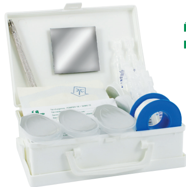
Ref : FAR 2014 PP

Un doigt sectionné, de la poussière dans les yeux, une particule métallique... Les risques d'accidents, petits ou grands, sont multiples et variés. L'équipement en matériel de premiers secours devant être adapté à la nature des risques, nous vous recommandons donc de ne pas négliger nos produits complémentaires.